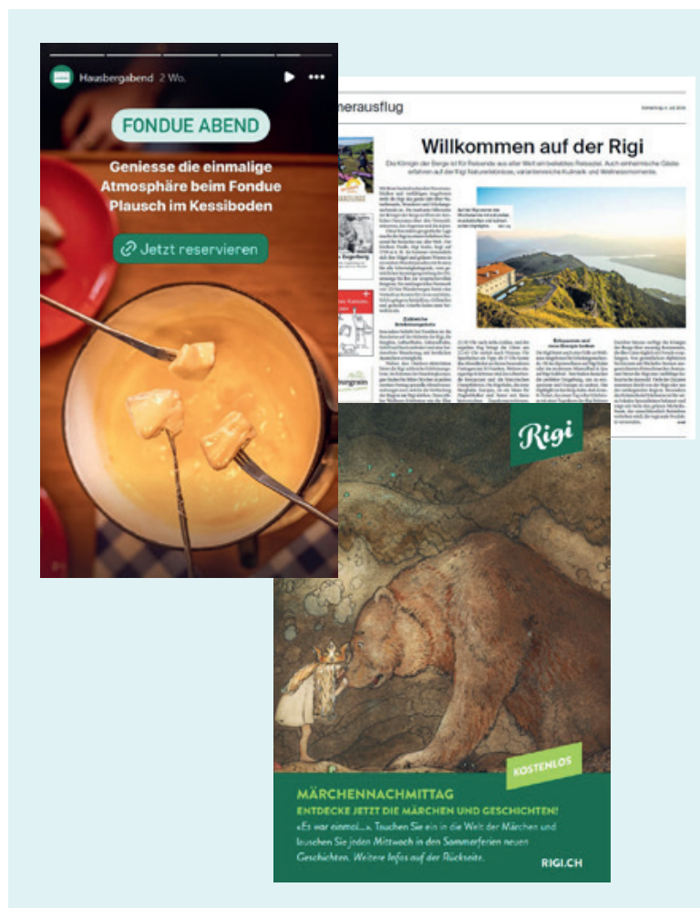
Auch 2024 waren die Partner der RigiPlus AG auf verschiedenen analogen und digitalen Plattformen vertreten.

Die RigiPlus AG engagiert sich auf vielfältige Weise, um das Leben auf der Rigi zu bereichern. Mit Projekten wie der Unterstützung des Rigi Chörlis, der Rigi Musiktage, der Rigi Schule oder der Empfehlung, an Nationalfeiertagen und Silvester auf Feuerwerk zu verzichten, wird ein spürbarer Beitrag zu einer hohen Lebensqualität auf dem Berg geleistet. Dieses Engagement zeigt, wie die RigiPlus AG den Anspruch verfolgt, die Rigi als lebendigen Ort mit einer hohen Lebens- und Aufenthaltsqualität für Bewohner und Gäste gleichermaßen zu gestalten – ein zentrales Ziel der Charta Rigi 2030.