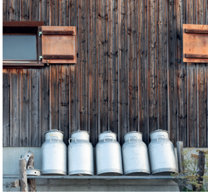
Traditionelle Alpwirtschaft: Frische Milch direkt von der Alp – ein Sinnbild für gelebte Bergkultur und nachhaltige Landwirtschaft auf der Rigi.

Im Gebiet Burggeist/Scheidegg stehen derzeit Projekte mit weitreichender Bedeutung für die gesamte Rigi im Fokus. Dazu zählen die Sanierung der Bahn Obergswend-Burggeist sowie die Planung eines Unterkunfts-konzepts für Burggeist/Scheidegg. Die RigiPlus AG begleitet die strategische Ausrichtung und die Weiterentwicklung des daraus entstehenden Angebotsportfolios unterstützend.