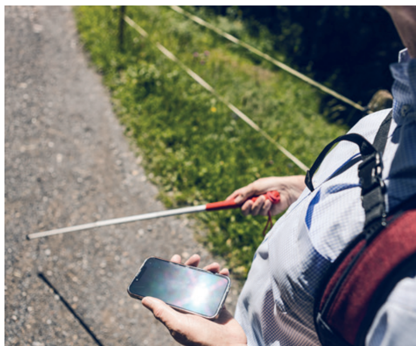
Barrierefreies Naturerlebnis: Mit moderner Technologie wird die Rigi auch für seh- und gehbehinderte Menschen zugänglich.

Das Projekt wurde durch eine Kooperation zwischen Procap Schweiz, Porsche Schweiz sowie der RigiPlus AG ermöglicht und verbindet Inklusion mit Tradition. Mit den neuen Wegen setzt die Rigi Region einen Standard für barrierefreien Tourismus und dient als Vorbild für andere Destinationen.