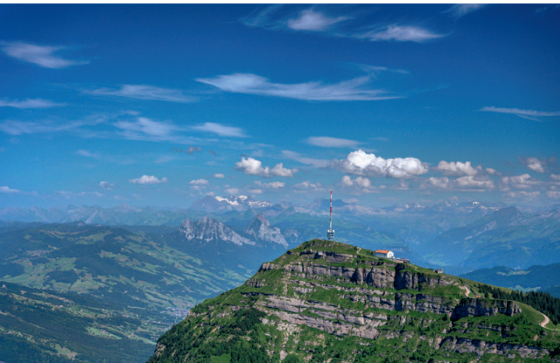
Die Rigi, die «Königin der Berge», begeistert mit einem atemberaubenden Panorama über die Alpen und das Schweizer Mittelland.

Für die Umsetzung wurden vier Schlüsselprojekte definiert. Zum einen sollen Audioguides entwickelt werden, mit denen Geschichten rund um die Rigi an ausgewählten Orten über QR-Codes hörbar gemacht werden können. Ein weiteres Projekt ist das Rigi-Besucherzentrum, bei dem ein altes Depot umgebaut wird, um die Geschichte des Tourismusbergs Rigi anhand der historischen Dampflokomotive Lok 7 aus dem Jahr 1873 zu präsentieren. Zudem wird mit dem Projekt «Musikberg Rigi» die musikalische Tradition der Region gefördert. Ergänzt wird das Gesamtangebot durch geführte und individuelle Touren zu den kulturellen Highlights der Rigi.